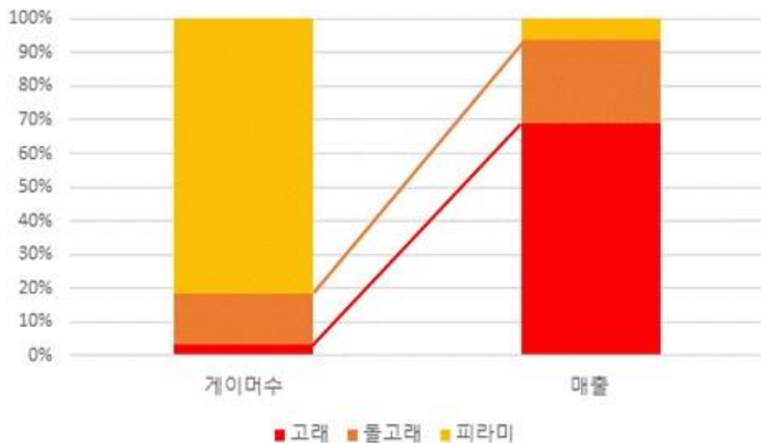
그림 1. 고래/돌고래/피라미 게이머의 비율과 각 게이머들이 차지하는 매출 비율

본 연구에서는 “2015년 Google Play 게임 카테고리 총 결산 보고서”를 참고하여 로그를 수집한 마지막 날짜를 기준으로 유료 결제 게이머들을 고래(Whale) 게이머, 돌고래(Dolphin) 게이머, 피라미(Minnow) 게이머의 3 가지로 분류하였으며 각각 100만원 이상, 100만원 미만 ~ 10만원 이상, 10만원 미만의 금액을 기준으로 나누었다. 이를 기준으로 결제를 한 게이머들을 분류할 경우 그림 1과 같이 각각 3.5%, 15%, 81.5%로 고래 유저들은 그 수가 매우 적지만, 매출에서는 큰 비중을 차지하는 것을 볼 수 있다.